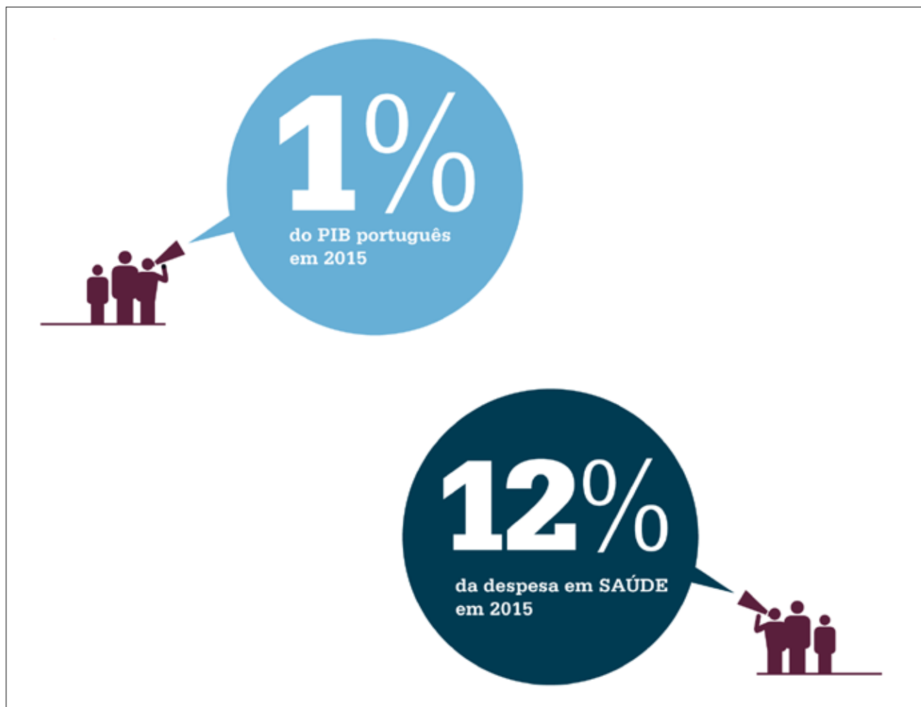
Figura 48 - Custos médios estimados da diabetes, em percentagem do PIB e das despesas em saúde, em 2015.