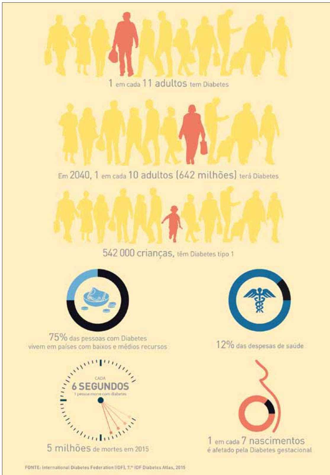
Figura 50 - Diabetes: impacto global.