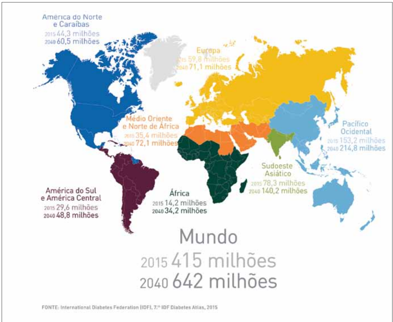
Figura 49 - Prevalência de diabetes por regiões geográficas: valores estimados para 2015 e 2040.