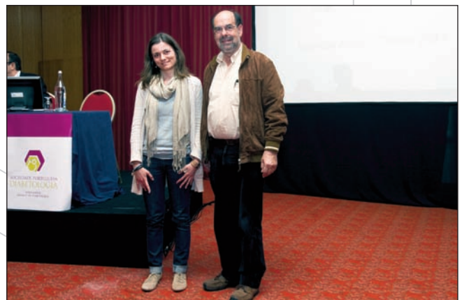
Reunião Anual da SPD (Tomar, 1 e 2 de Abril 2011): Entrega do Prémio Hargreaves SPD/JABA.