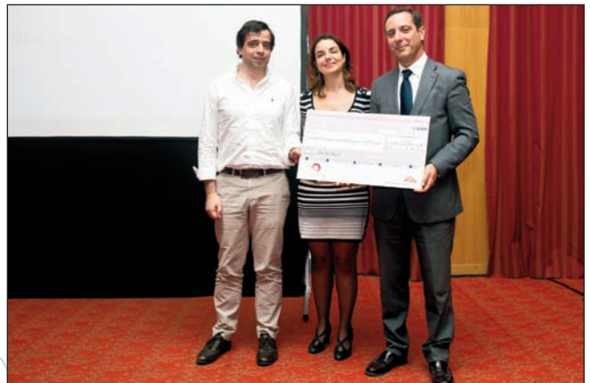
Reunião Anual da SPD (Tomar, 1 e 2 de Abril 2011): Entrega do Prémio de Investigação Clínica na Diabetes Nuno Castel-Branco SPD/ Lilly Portugal.