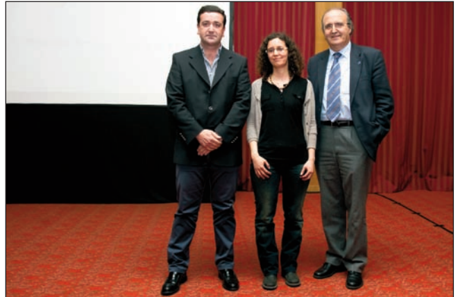
Reunião Anual da SPD (Tomar, 1 e 2 de Abril 2011): Entrega da Bolsa Dr. M. M. Almeida Ruas SPD/Novo Nordisk.